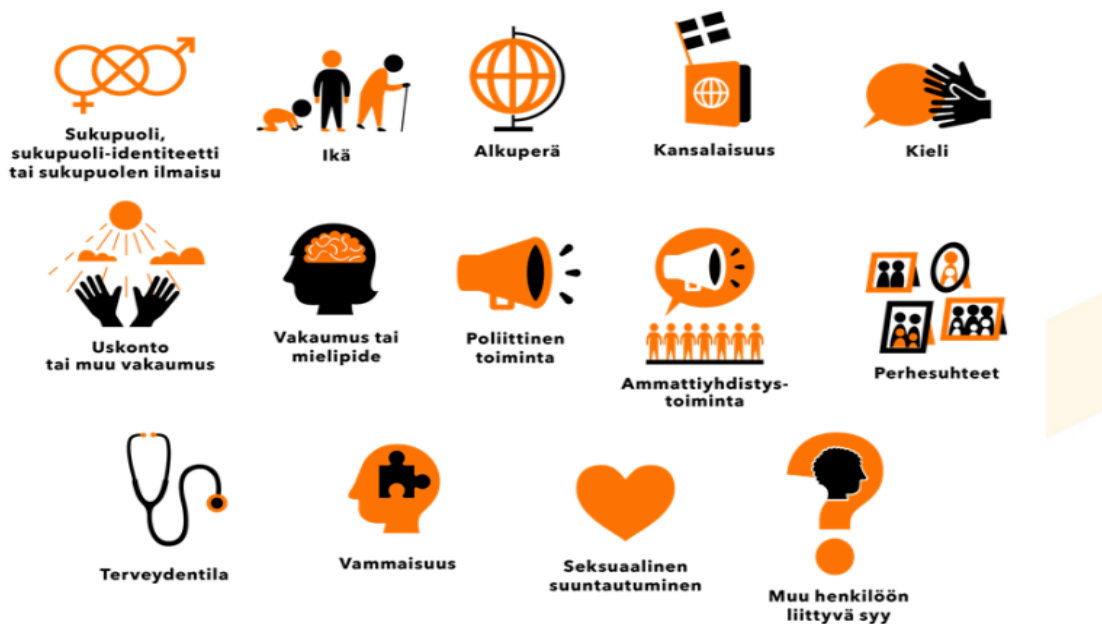
Kuva 2. Syrjintäperusteet. Lähde: Ekvälita. Meidän amiksesta kaikkien amis! Opas ammatillisten oppilaitosten tasa-arvo- ja yhdenvertaisuustilanteen kartoittamiseen.

Häirintää ja syrjintää ennaltaehkäistään seuraavin toimenpitein: jokaisessa oppilaitoksessa keskustellaan häirintään liittyvistä asioista yhteisten ohjeistusten mukaisesti, oppilaitoksilla on kiusaamistapausten käsittelyyn selkeät toimintaohjeet, oppilaitoksissa pyritään luomaan toimintakulttuuri, jossa häirinnän sivustaseuraajia ei ole, vaan jokainen osaa ja uskaltaa puuttua koulussa esiintyvään häirintään ja pitää häirityn puolta.